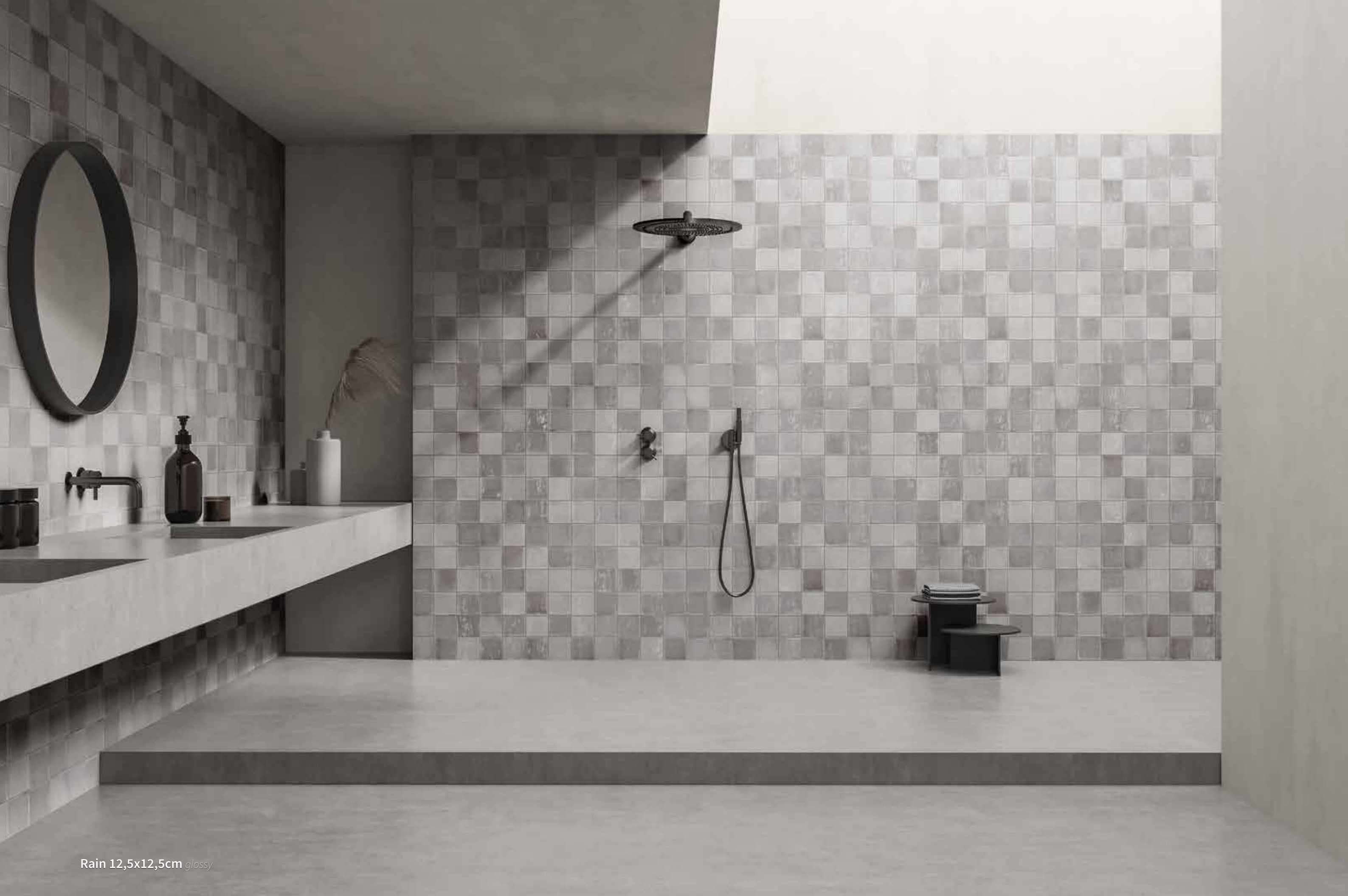
Rain 12,5x12,5cm glossy