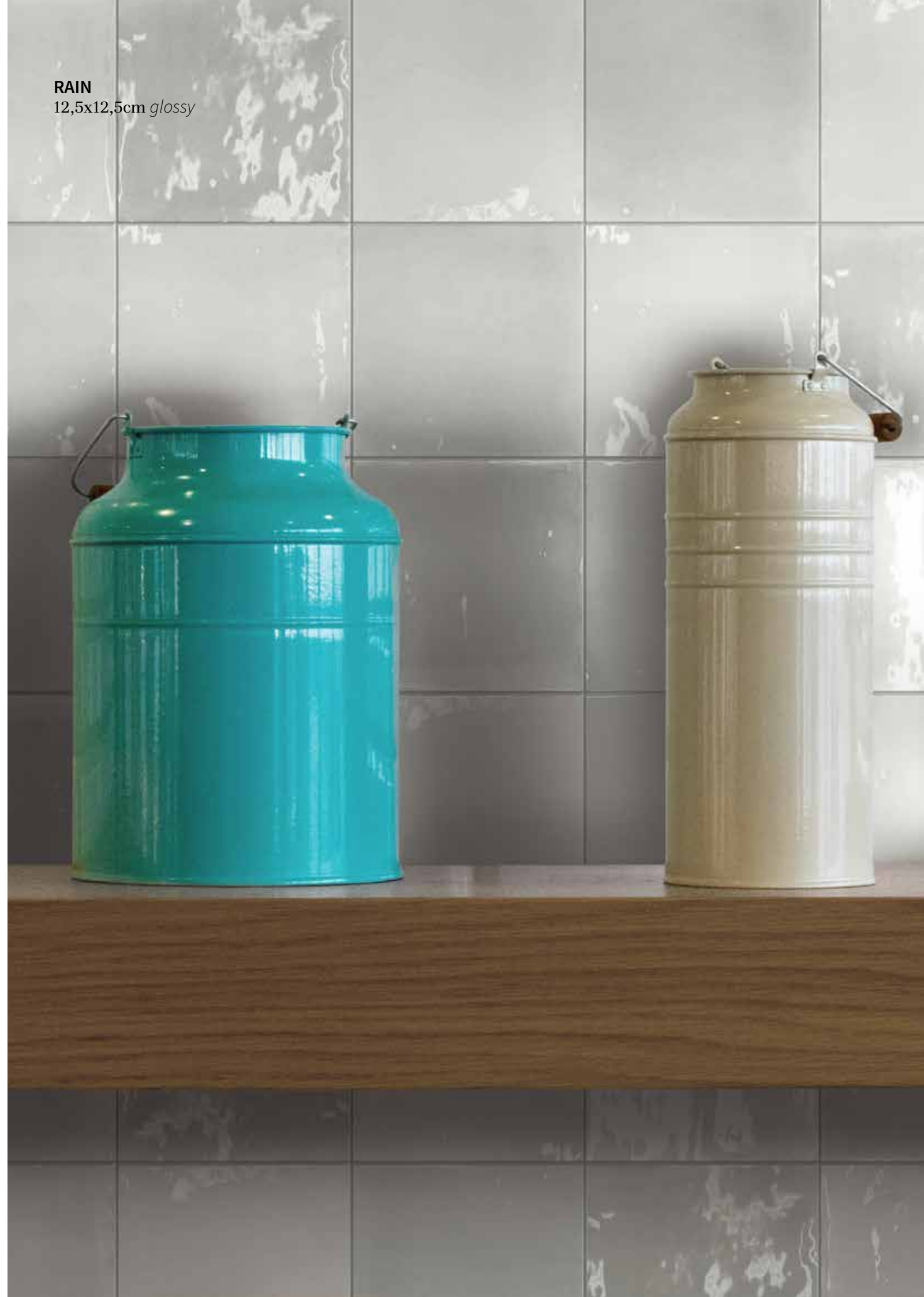
RAIN 12,5x12,5cm glossy