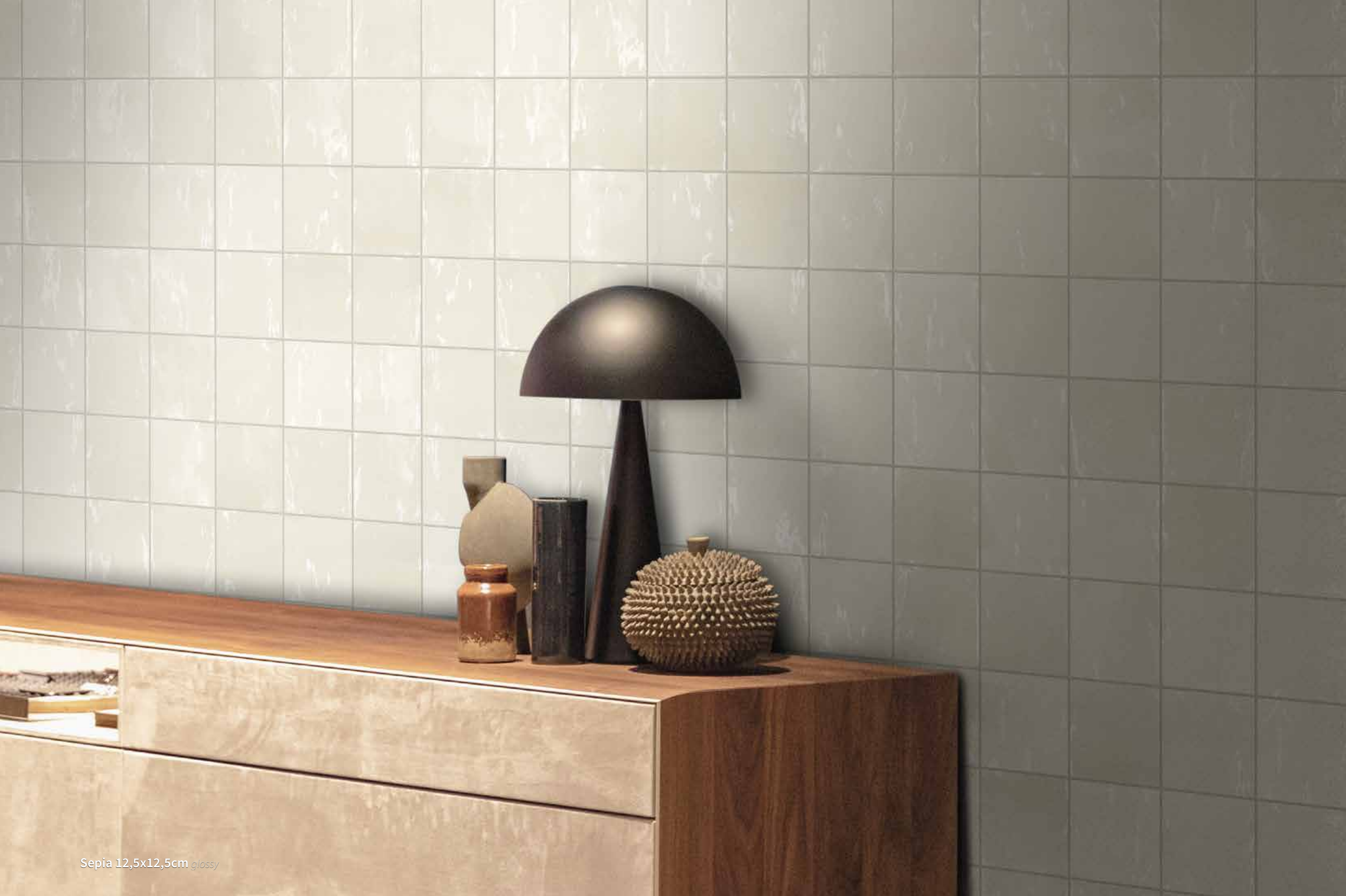
Sepia 12,5x12,5cm glossy