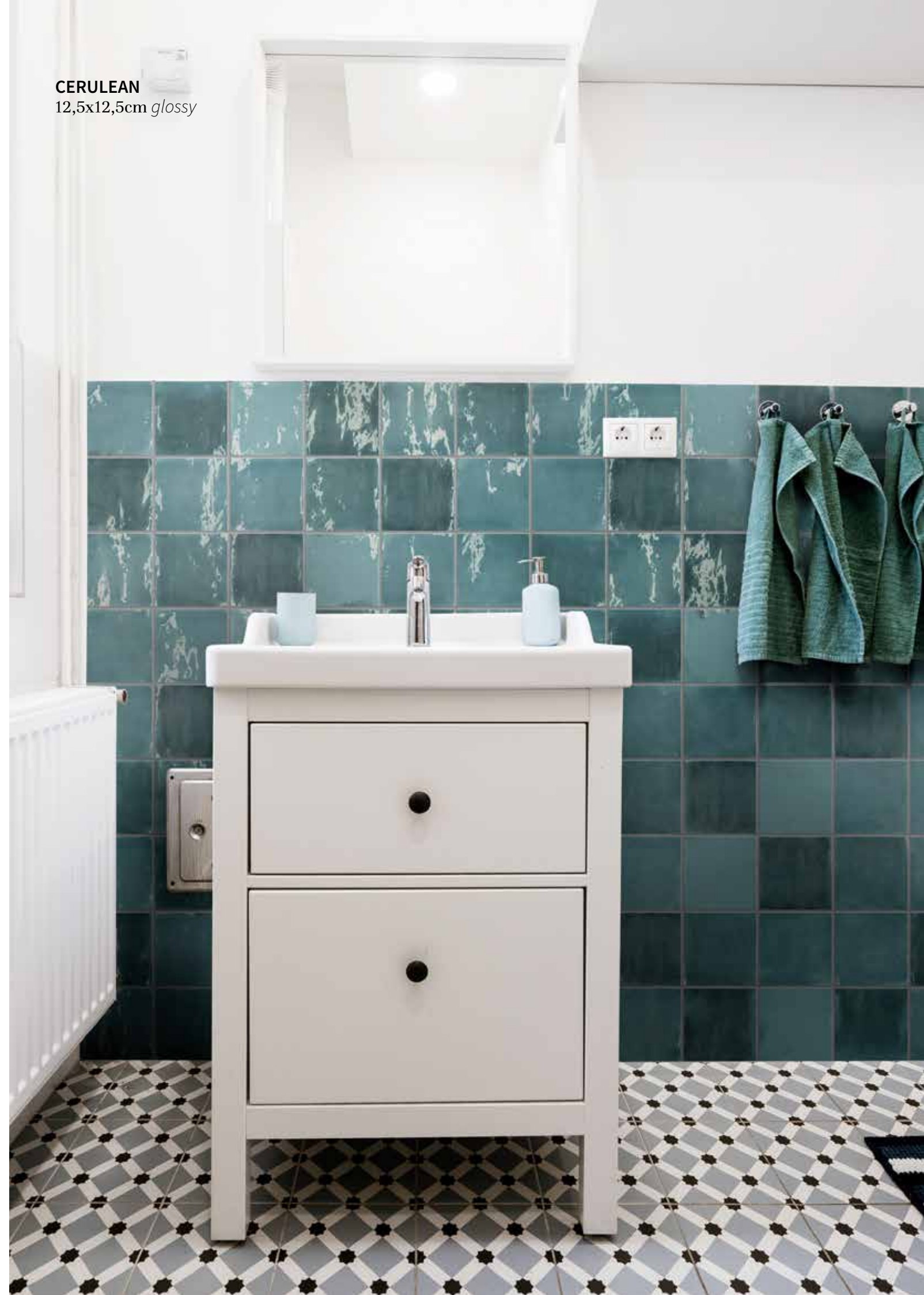
CERULEAN 12,5x12,5cm glossy