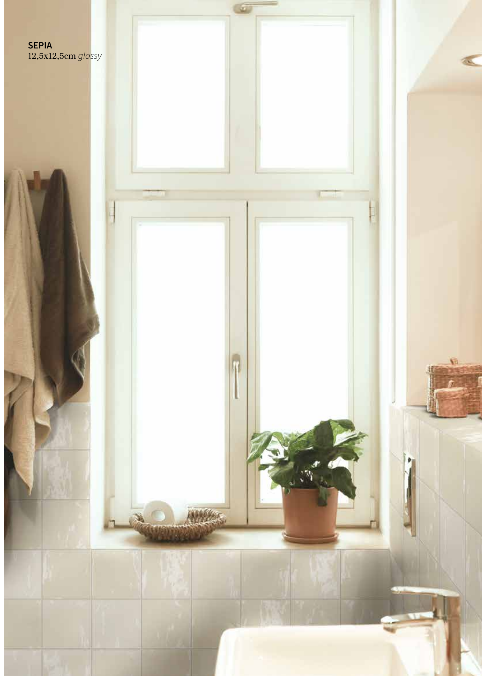
SEPIA 12,5x12,5cm glossy