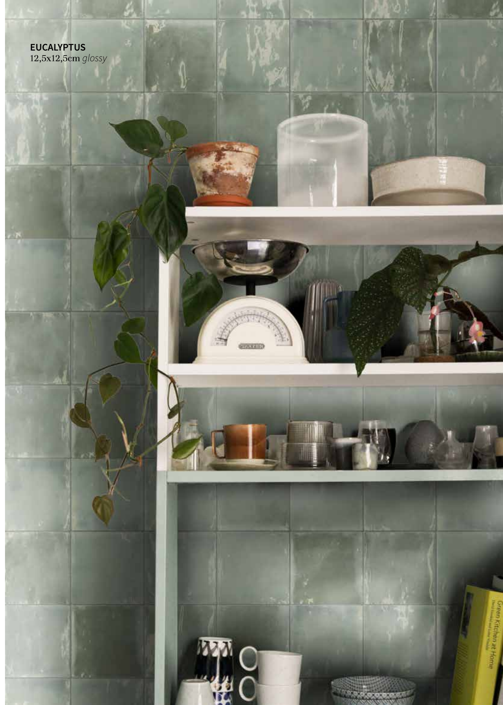
EUCALYPTUS 12,5x12,5cm glossy