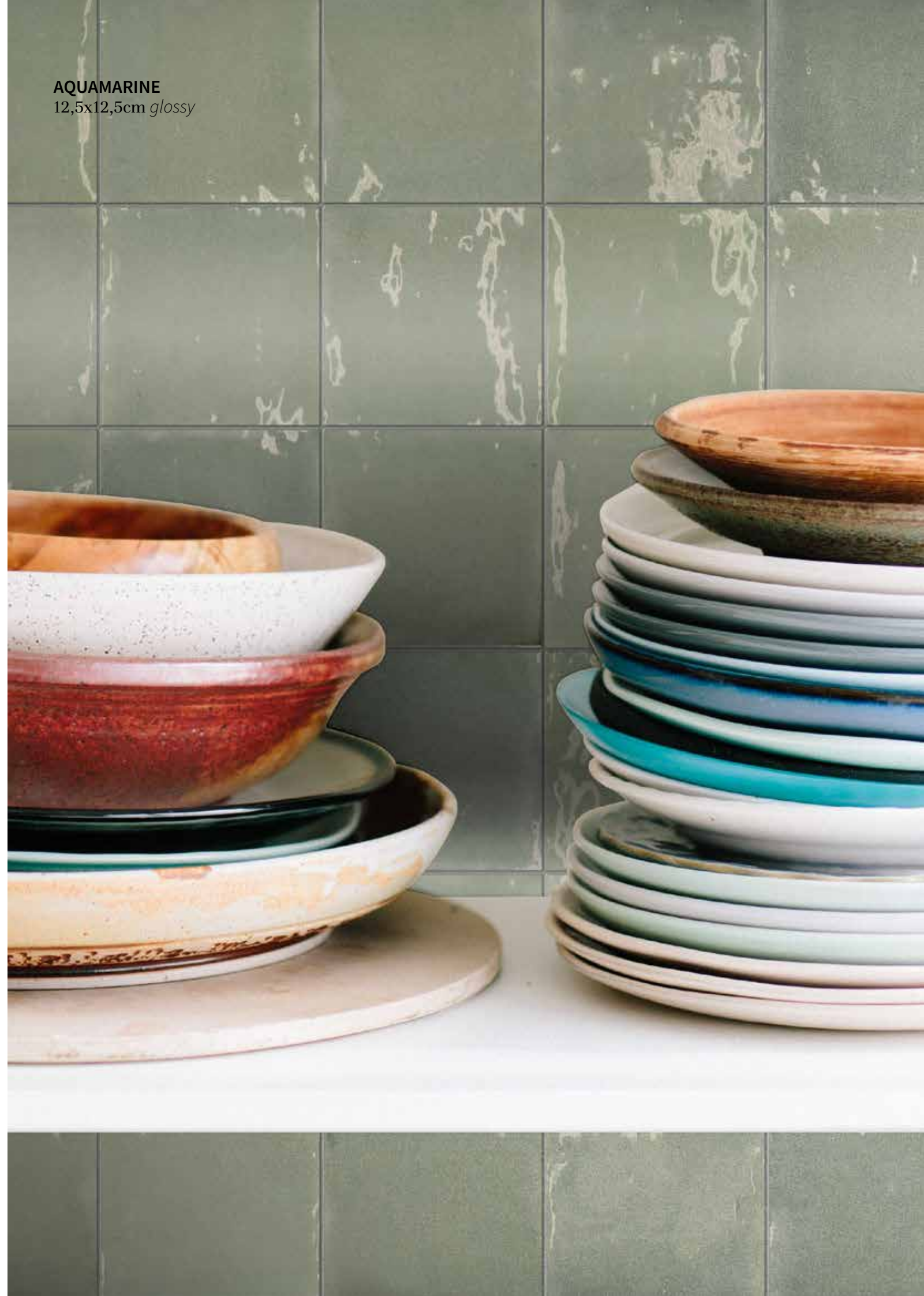
AQUAMARINE 12,5x12,5cm glossy