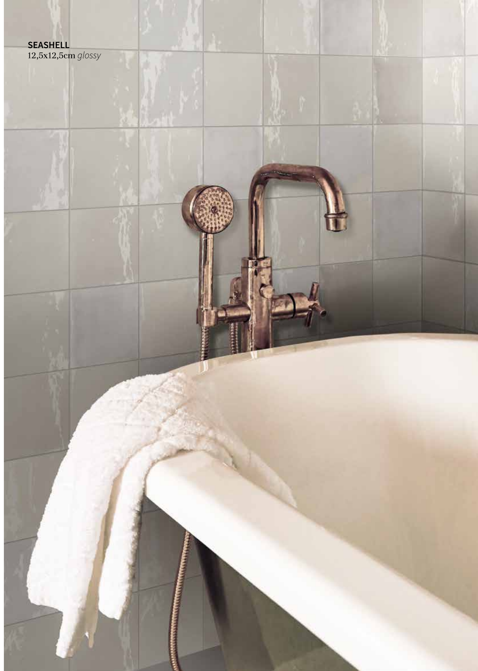
SEASHELL 12,5x12,5cm glossy