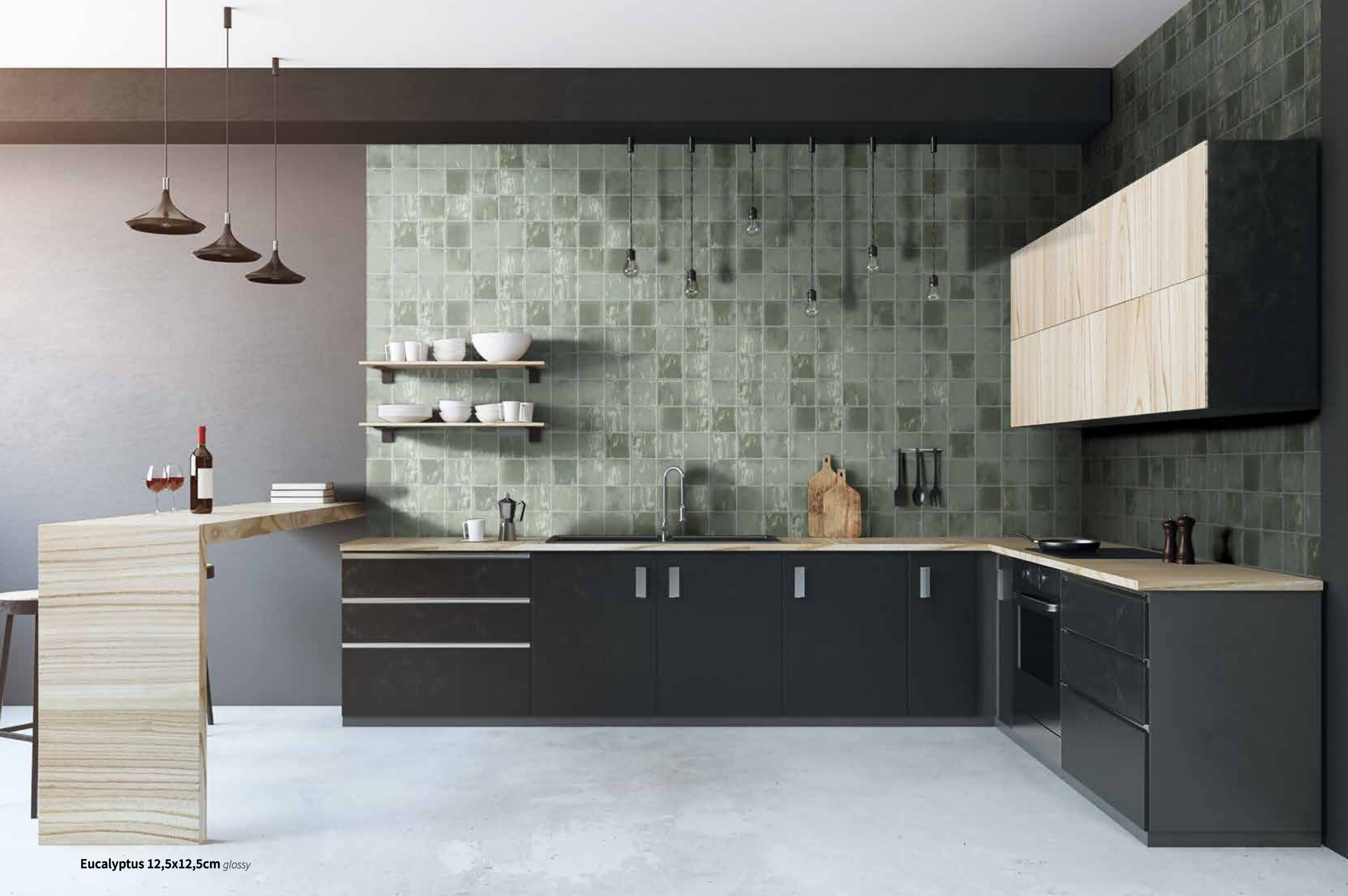
Eucalyptus 12,5x12,5cm glossy