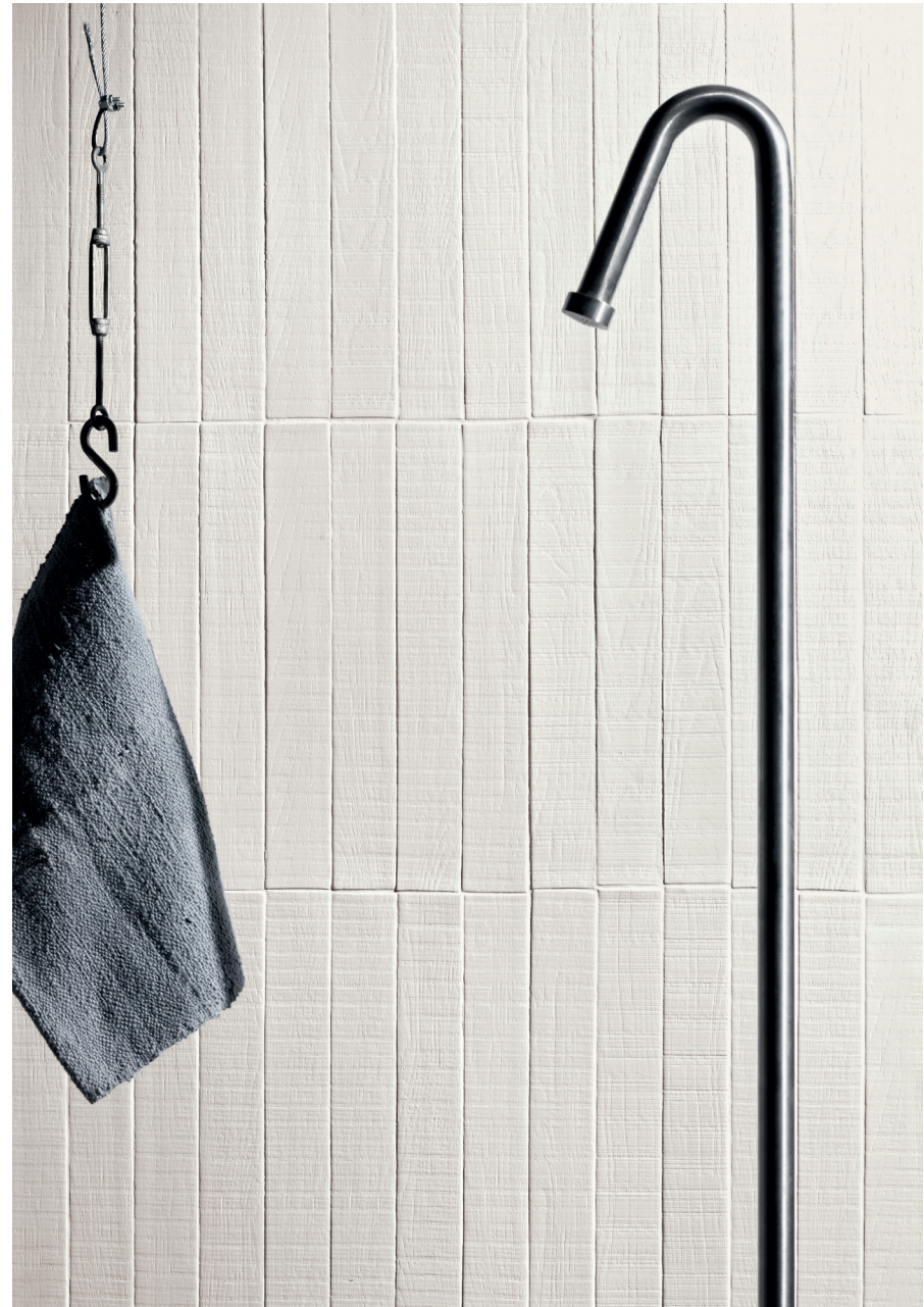
Rigo White 5x35,5 2"x14"