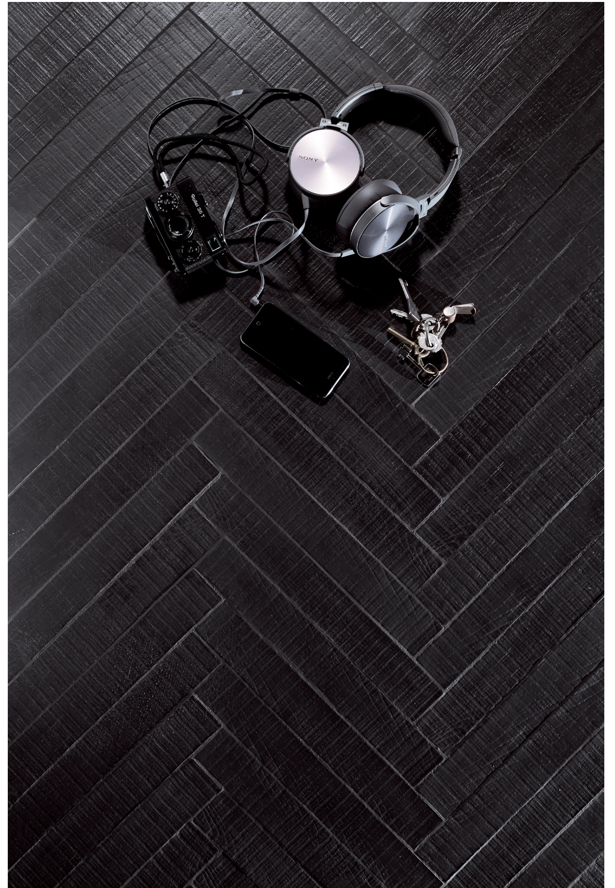
Rigo Black 5x35,5 2"x14"